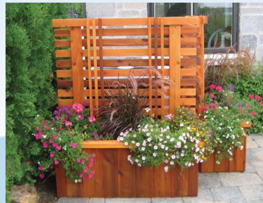
Voici d'ailleurs un exemple mis en place par nos professionnels.

Paysagiste pourra vous aider, non seulement à choisir l'emplacement qui répond à des considérations pratiques, mais à bien les intégrer à votre décor. Par exemple, il est possible de prévoir un treillage devant ces objets et d'y accrocher quelques plantes grimpantes.